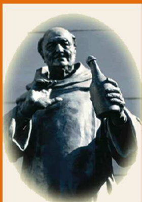
Dom Pérignon 1638 – 1715